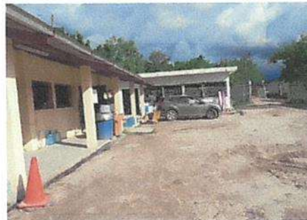
Foto 4: Se aplicara pintura en muros interior y exterior de todo el centro educativo