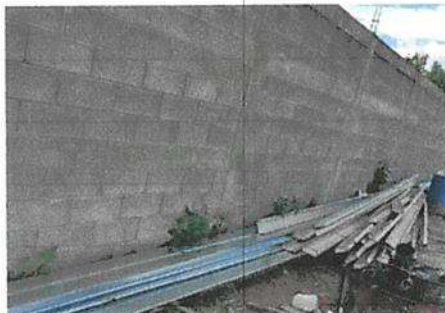
Foto 3: Se elaborara una banqueta para que los estudiantes tengan donde sentarse a la hora del recreo