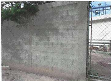
Foto 1: Se aplicara repello en pared para colocar el logo del establecimiento